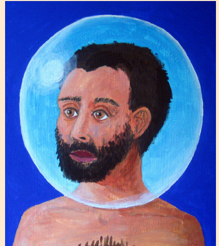
Matthias Illner, „Gemeinsam allein“, Acryl auf Leinwand 2018 www.matthiasillner.de

Einladung zum Psychose-Seminar Pankow September 2022 bis Juni 2023